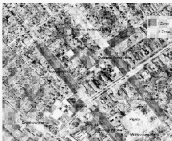
Слика: Зонирано подручје насељеног места Инђије

Свака зона је видно обележена саобраћајним знаком и додатном таблом која показује у којој се зони налазите. Наплата паркирања се врши од 7 до 21 радним данима, а суботом од 7 до 14 часова. Недељом и државним празницима се паркирање не наплаћује.